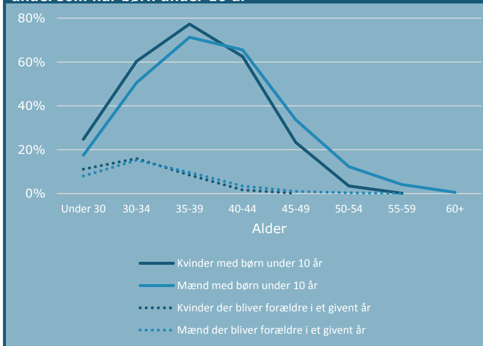
Figur 2. Andel akademikere som bliver forældre i et givent år og andel som har børn under 10 år

Anm.: Figuren angiver andel blandt lønmodtagerakademikere, som bliver forældre og andel som har børn under 10 år.